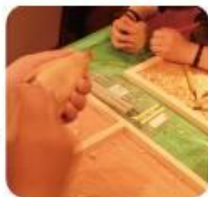
彫刻刀で木を彫って